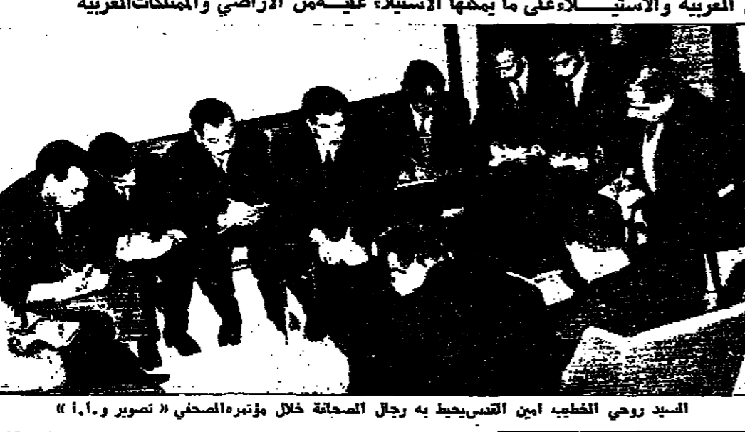
السيد روحى الخطيب أمين القدس يحيط به رجال الصحافة خلال مؤتمره الصحفي

«بالأمس فقط نسفوا عمارة في باب الساهرة وفتدقا في البيرة» أمين القدس يتحدث عن أسباب إبعاده وعن المخطط الاسرائيلي الواسع لتهود المدينة